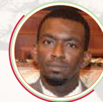
NAÏR ABAKAR Ambassadeur République du Tchad