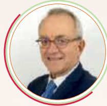
GÉRARD WOLF Président de la task force Ville durable et président MEDEF International et BRICS Access