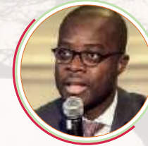
KHALED IGUÉ Économiste et Président Club 2030 Afrique